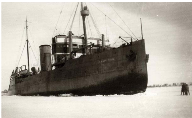
Navire brise-glace

Finalement, un grand merci aux bénévoles qui se présentent assidument aux rencontres du Conseil d'administration et du Comité exécutif du Comité ZIP des Seigneuries.